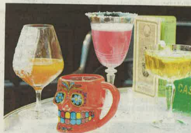
Welcher Cocktail schmeckt am besten?