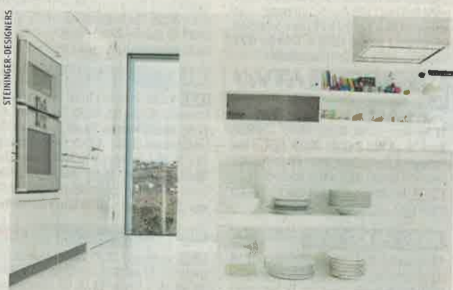
Die Designlinien der Küchen setzen auf Reduktion und Archaik