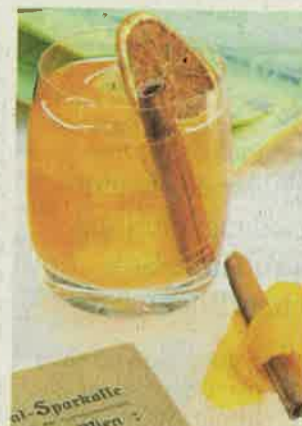
#JointPassbook: für Liebhaber der Old Fashioned Cocktails

Bonus einlösen. Das Team von The Bank Bar präsentiert ihren nächsten Coup – etwas, was es so in keiner anderen Bar gibt. Eine Cocktailkarte, die nicht nur mit besonderen Getränke-Kreationen überzeugt, sondern Gästen auch die Möglichkeit bietet, einen persönlichen Bonus zu erhalten. Entstanden ist eine Cocktailkarte mit 10 einzigartigen Cocktails, in Form eines Sparbuchs. Personalisiert und im Hosentaschen-Format, können Gäste bei jedem Besuch ihre Konsumation eintragen lassen und ab einem bestimmten Wert in Form eines Bonus einlösen. Und der Geschmack der Cocktails ist ganz besonders. Jeder Bar-Mitarbeiter hat im Entstehungsprozess seinen persönlichen Teil zur Rezeptur beigetragen und so für komplexe, einzigartige Geschmäcker gesorgt. Ebenso durchdacht, wie die Rezepturen der Cocktails, sind ihre Namen. Als Grundlage hierfür dienten Begriffe, die zu Zeiten in denen Sparbücher noch weitverbreitet waren, genutzt wurden. So findet man im neuen Sparbuch neben dem #Direct Deposit mit dem Geschmack süßer Kokos Prali-