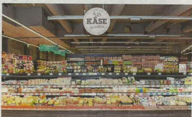
Käsespezialitätenbereich im MERKUR Markt in 1220 Wien, Zwerchäckerweg 20-24

rei über 30 Variationen an Mehlspeisen und Torten. Auf Wunsch können diese auch vorbestellt sowie individuell verziert werden. Ebenfalls nicht fehlen darf im neuen Markt das 7.000 Produkte umfassende „Da komm ich her“-Sortiment von mehr