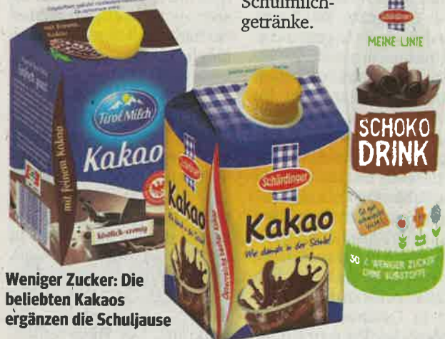
Weniger Zucker: Die beliebten Kakaos ergänzen die Schulkause

den Trinkkakaos schon jetzt unter 4 Prozent. Zusammen mit dem natürlich vorkommenden Milchzucker ergibt das einen Gesamtzuckergehalt von nur 8,4 g/100ml. Damit entsprechen die Schärdinger und Tirol Milch Kakaos deutlich den entsprechenden Richtlinien für Schulmilchgetränke.