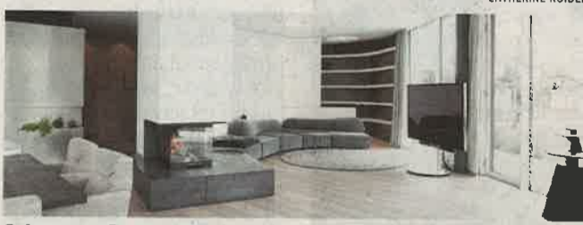
Gelungenes Zusammenspiel zwischen Architektur und Design

Besser wohnen. In den hügeligen Weinbergen von Retz in Niederösterreich findet sich eine gelungene, visionäre Symbiose von Architektur und Interior-Design – mit dem Blick fürs Wesentliche. Die zwei markanten, weißen Ebenen des Hauses sowie der ungewöhnlich geschwungene Grundriss, bestimmen das Gebäude mitten im Ortsgebiet der Stadtgemeinde Retz im Weinviertel, nahe der hügeligen Weinberge. Sie sind ein klares Bekenntnis des design- und architekturaffinen Bau-