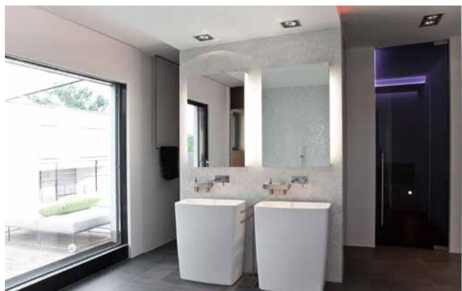
Die Bauherren wünschten sich ausdrücklich die Kombination von Bad und Wellness: Badewanne aus Corian und Armaturen von Antonio Lupi – Wandmo-saikfliesen hinter den Standwaschtischen von A. Lupi sind von Bisazza – Dusche mit Rainsky-Modul von Dornbracht ist komplett verglast und lässt bis auf die Terrasse blicken – individuelle Lichtstimmungen sind durch indirektes LED-Licht per Fernbedienung zu programmieren und tragen zur Wohlfühl-atmosphäre bei.