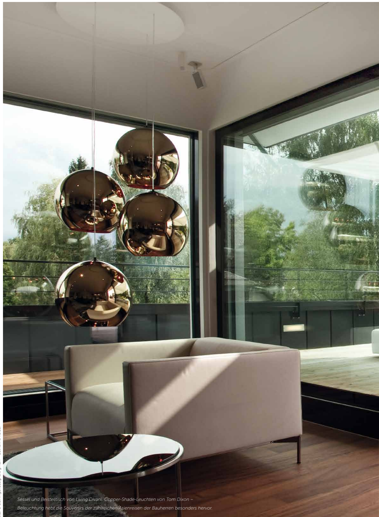
Sessel und Beistelltisch von Living Divani, Copper-Shade-Leuchten von Tom Dixon – Beleuchtung hebt die Souvenirs der zahlreichen Asienreisen der Bauherren besonders hervor.