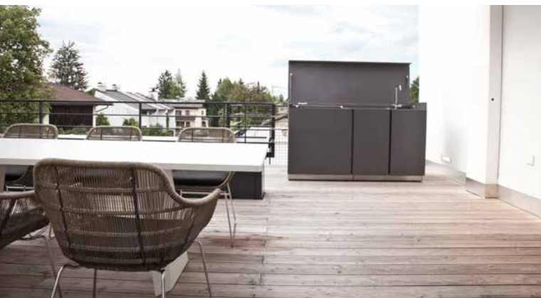
Die Hauptterrasse zeigt, dass Qualität und Komfort auch außen perfekt umgesetzt wurden: witterungsbeständige und wasserfeste anthrazitfärbige Outdoorküche von Steininger mit Gasgriller, Spüle und Stauraum – Loungesofa und Beistelltische von Living Divani – Tischgruppe von Living Divani – Sonnensegel von Sunsquare – Boden aus Lärche.