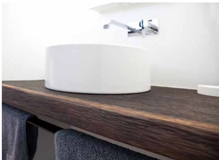
GÄSTE-WC: Platte aus Räuchereiche (dasselbe Material wie der Esstisch) mit einem Aufsatzwaschtisch aus Corian.