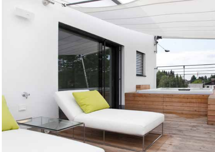
Die zweite Terrasse bietet Hotelkomfort für zuhause: Daybeds in Weiß mit gelben Pölstern von Living Divani – Whirlpool von Teuco – Sichtschutz von Extremis.