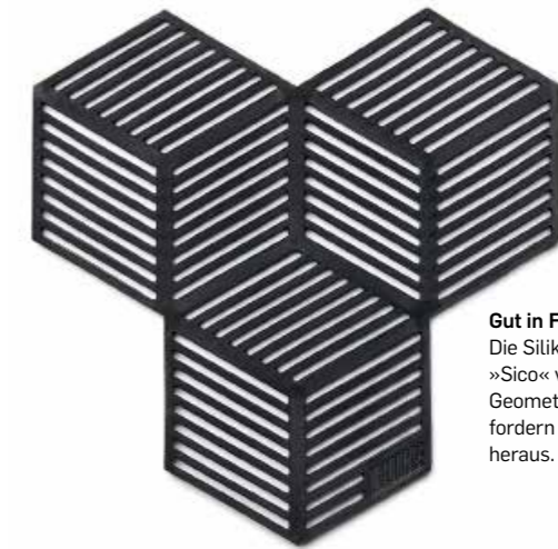
Gut in Form Die Silikonuntersetzer »Sico« von Puik bringen Geometrie ins Spiel und fordern so die Blicke heraus. puikdesign.com

Küche ist nicht gleich Küche. LIVING präsentiert vier Vorzeige-Objekte und wie man sie heute zwischen New York und Stockholm perfekt inszeniert. Die passenden Küchen-Accessoires und Gadgets punkten in Design wie Optik und vermitteln ein stilvolles Ganzes.