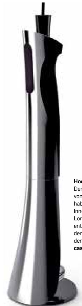
Hochtourig Den Stabmixer EVA von Casa Bugatti haben die Designer Innocenzo Rifino & Lorenzo Ruggieri entworfen. Für viele der Ferrari unter den Pürrierstäben. casabugatti.com