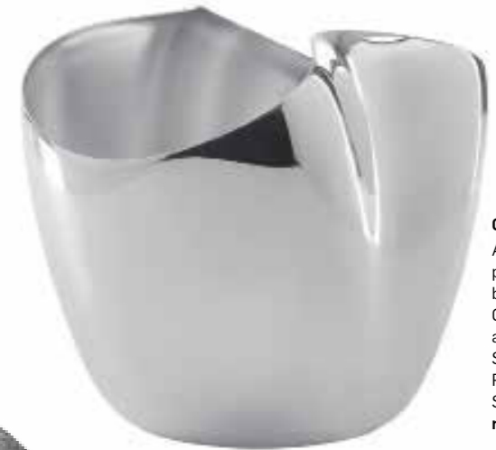
Glanzleistung Auf Hochglanz polierter Edelstahl bildet bei diesem Champagner-Kübel aus der »Drift«-Serie den perfekten Rahmen für edlen Schaumwein. robertwelch.com