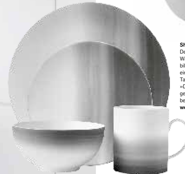
Shades of Grey Designstar Vera Wang und Wedgwood bilden schon länger ein gutes Gespann. Die Tableware-Kollektion »Degradée« kann als gelungener Output bezeichnet werden. wedgwood.co.uk