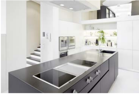
Bild 1: „PenthouseW1.jpg“ Küche „SLIM“ in Aluminium Braun und Hochschrank „WALL“ von STEININGER