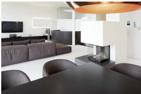
Bild 7: PenthouseW_ Esstische von STEININGER, Sessel Mini Jelly von Living Divani, Sofa „Family Lounge“ von Living Divani