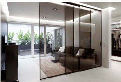
Bild 4: „PenthouseW4.jpg“ Glas Schiebetüren „Velaria“ von Rimadesio, Sofa „Family Lounge“ von Living Divani, Teppiche von Casalis