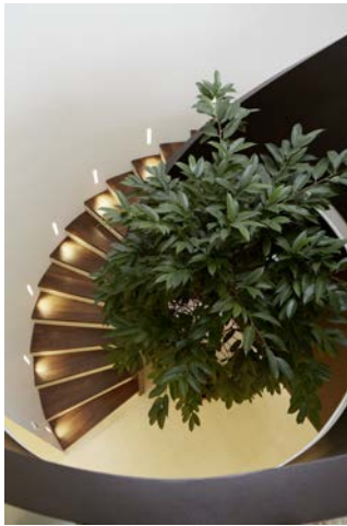
Bild 5: „PenthouseW5.jpg“ Die Wendeltreppe – der Eingang zum Penthouse.