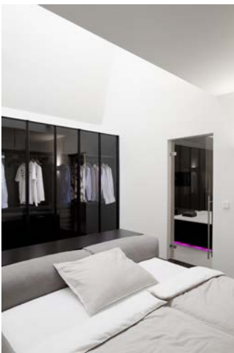
Bild 10: „PenthouseW10.jpg“ Kleiderschrank „Storage Air“ von Porro und Bett „Wall“ von Living Divani.