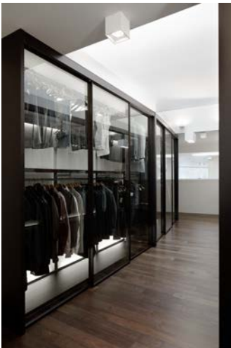
Bild 9: „PenthouseW9.jpg“ Schrankraum System „Dress“ und „Velaria“ von Rimadesio