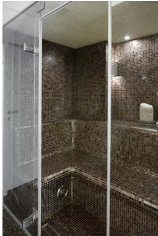
Bild 6: „PenthouseW6.jpg“ Das Dampfbad von Klafs aus original Bisazza Mosaik.