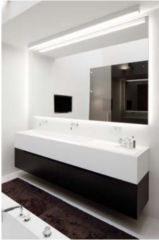
Bild 8: „PenthouseW8.jpg“ Waschtisch „Zone“ von Boffi mit Armaturen Serie von Vola.