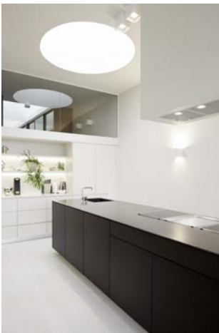
Bild 2: „PenthouseW2.jpg“ Die Aluminium Küche „SLIM“ von STEININGER.