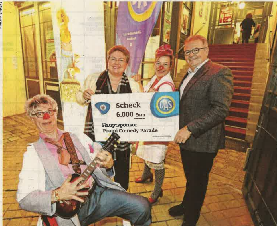
Die D.A.S. übernahm das Hauptsponsoring der „CliniClowns Promi Comedy Parade“ zum zweiten Mal

Das Ziel, Chancengleichheit herzustellen, wird auch von der Belegschaft im Rahmen