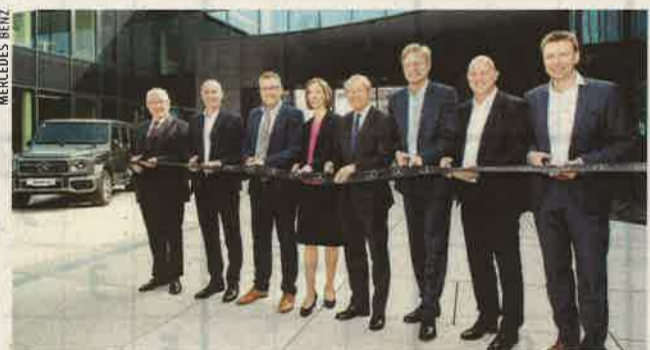
Die feierliche Eröffnung der neuen Österreichzentrale in Eugendorf – ein neues Zuhause für den Stern

Bündelung aller Kräfte. Die neue Österreichzentrale in Eugendorf wurde im April besiedelt