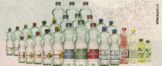
Römerquelle-Flaschen bestehen zu 100 Prozent aus Recycled-PET

Mit der Umstellung auf die 100 Prozent Recycled-PET-Flasche geht auch eine signifikante Reduktion des CO 2 -Verbrauchs einher: Im Vergleich zu PET-Flaschen der ersten Generation (ohne Anteil von recyceltem Material) sinkt der Wert um bis zu 70 Prozent! Und je öfter Kunststoff wiederverwendet wird, umso besser wird die Klimabilanz.