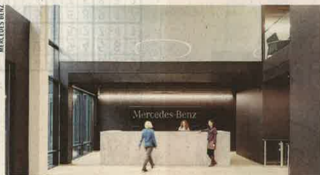
Im Zuge einer mehrmonatigen Standortprüfung stach Eugendorf letztlich Städte wie Linz oder Wien aus

In rund eineinhalb Jahren Bauzeit entstand das neue Headquarter für Mercedes-Benz. Nach dem Motto „Alle unter einem Dach“ werden im neuen Bürokomplex am Mercedes-Benz-Platz 1 in Eugendorf zukünftig die Aktivitäten der Sparten Cars, Vans und Trucks sowie jene der Mercedes-Benz Financial Services Austria GmbH und der