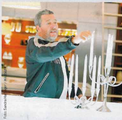
Philippe Starck vor seiner Küche bei der letztjährigen Wohndesign Hofburg-Präsentation

Ikonen wie Starck erfüllen aber noch eine weitere wichtige Funktion: Sie kommen gewissermaßen auch als Wegbereiter für die Formengeber, die sich den Ruf