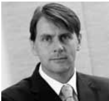
PROJEKTMANAGEMENT THEODOR POPPMEIER WWW.CGT.AT